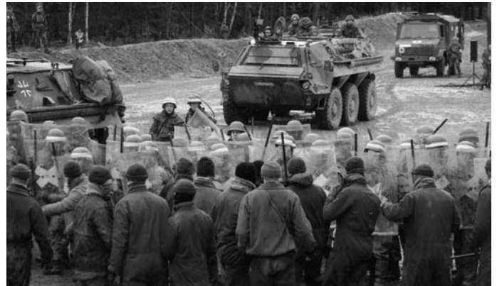
Februar 2007: Soldaten des JgBtl 292 bei der Ausbildung gegen Demonstranten (sämtliche „Demonstranten“ tragen Blaumänner).

In Heiligendamm waren es nicht nur Soldaten, die die Bevölkerung erwarteten, sondern Tornados und Spürpanzer. Was dahinter steckt, erkennt man an den Truppenübungen.